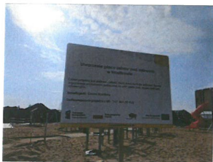
Tablica pamiątkowa umieszczona na placu zabaw