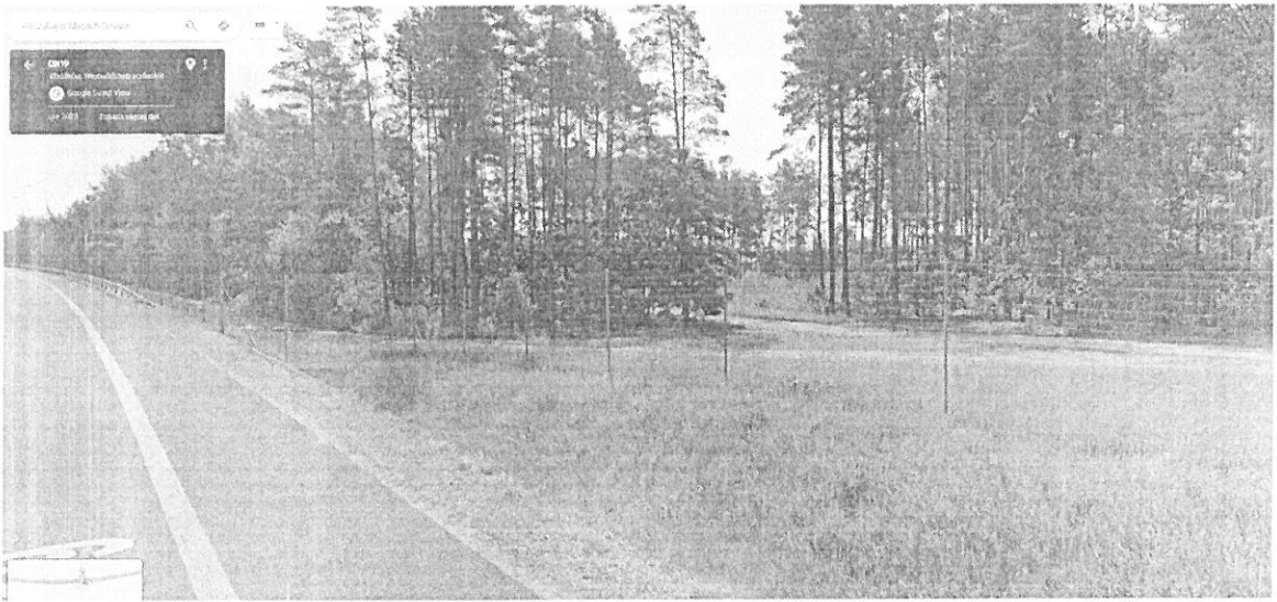
Fotografia okolic ul. Cedrowej wedle stanu z 2023 r.