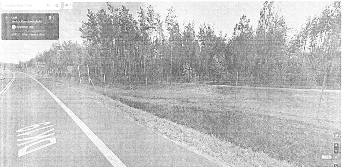
Fotografia okolic ul. Cedrowej wedle stanu z 2012 r. – rok po oddaniu Obw. Wasilkowa do ruchu publicznego.

Wskazany wyżej odcinek „drogi” nie jest drogą, a jest w istocie jedynie „zajeżdżonym pasem terenu” w pasie drogowym będącym w zarządzie GDDKiA.