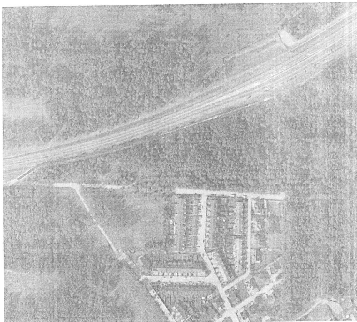
Mapa pomocnicza okolic ul. Cedrowej w Wasilkowie w sąsiedztwie tzw. Osiedla Leśnego.

plan zagospodarowania - w załączeniu) i nie została ówczasnie zrealizowana w terenie, co potwierdzają również archiwalne fotografie terenowe.