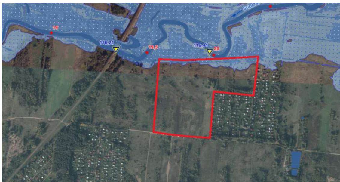
Mapa Nr 1. Mapa zagrożenia powodziowego dla obszaru nr 5 (Wasilków N-34-107-A-d-3).

Ochronę przed powodzią prowadzi się z uwzględnieniem map zagrożenia powodziowego, map ryzyka powodziowego oraz planów zarządzania ryzykiem powodziowym. Od dnia przekazania map zagrożenia powodziowego i ryzyka powodziowego jednostkom samorządu terytorialnego, w decyzjach o ustaleniu lokalizacji inwestycji celu publicznego lub decyzjach o warunkach zabudowy na obszarach wykazanych na mapach zagrożenia powodziowego, można uwzględniać poziom zagrożenia powodziowego wynikający z wyznaczenia tych obszarów. Na podstawie mapy zagrożenia powodziowego (arkusze Wasilków) ustalono, że niewielka część obszarów 5,6,8 leży w strefie zagrożenia powodziowego. Są to tereny położone w obrębie miasta Wasilkowa. W 2015 r. na Hydroportalu opublikowane zostały zweryfikowane i ostateczne wersje map zagrożenia powodziowego i map ryzyka powodziowego. Jednocześnie mapy zostały przekazane przez Prezesa Krajowego Zarządu Gospodarki Wodnej organom administracji wskazanym w ustawie Prawo wodne i jako oficjalne dokumenty planistyczne stanowią podstawę do podejmowania działań związanych z planowaniem przestrzennym i zarządzaniem kryzysowym. (mapy.isok.gov.pl). Na poniższych mapach przedstawiono obszary, na których prawdopodobieństwo wystąpienia powodzi jest wysokie i wynosi raz na 10 lat Q_{10\%} (na tle mapy zagrożenia powodziowego).