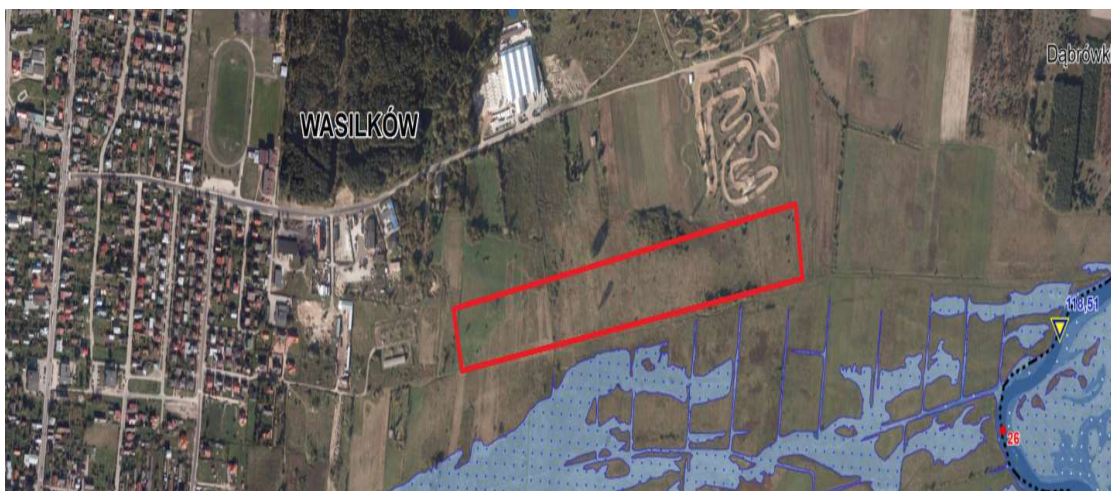
Mapa Nr 3. Mapa zagrożenia powodziowego dla obszaru nr 8 (Wasilków N-34-107-A-d-4).

Mapa zagrożenia powodziowego wraz z głębokością wody, obszary na których prawdopodobieństwo wystąpienia powodzi jest wysokie i wynosi raz na 10 lat (Q10%). Maksymalna rzędna zwierciadła wody 117,89 , głębokość wody przy zalaniu - maksymalnie 0,5 m.