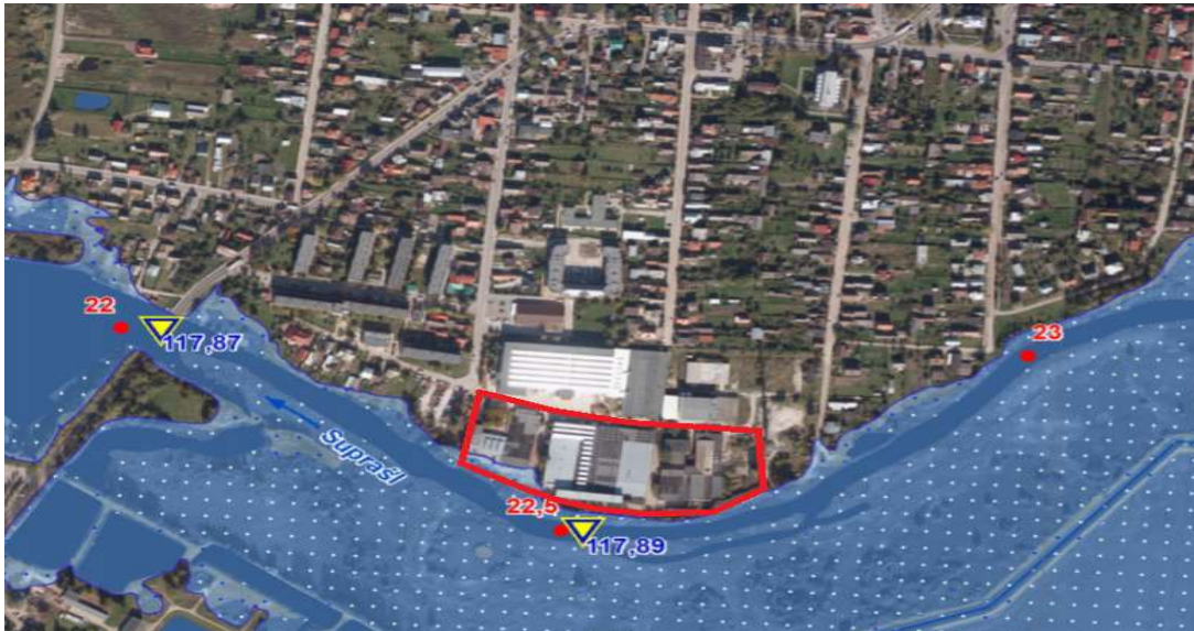
Mapa Nr 2. Mapa zagrożenia powodziowego dla obszaru nr 6 (Wasilków N-34-107-A-d-4).

Mapa zagrożenia powodziowego wraz z głębokością wody, obszary na których prawdopodobieństwo wystąpienia powodzi jest wysokie i wynosi raz na 10 lat (Q10%). Maksymalna rzędna zwierciadła wody na rzece 116,41 , głębokość wody przy zalaniu - maksymalnie 0,5 m.